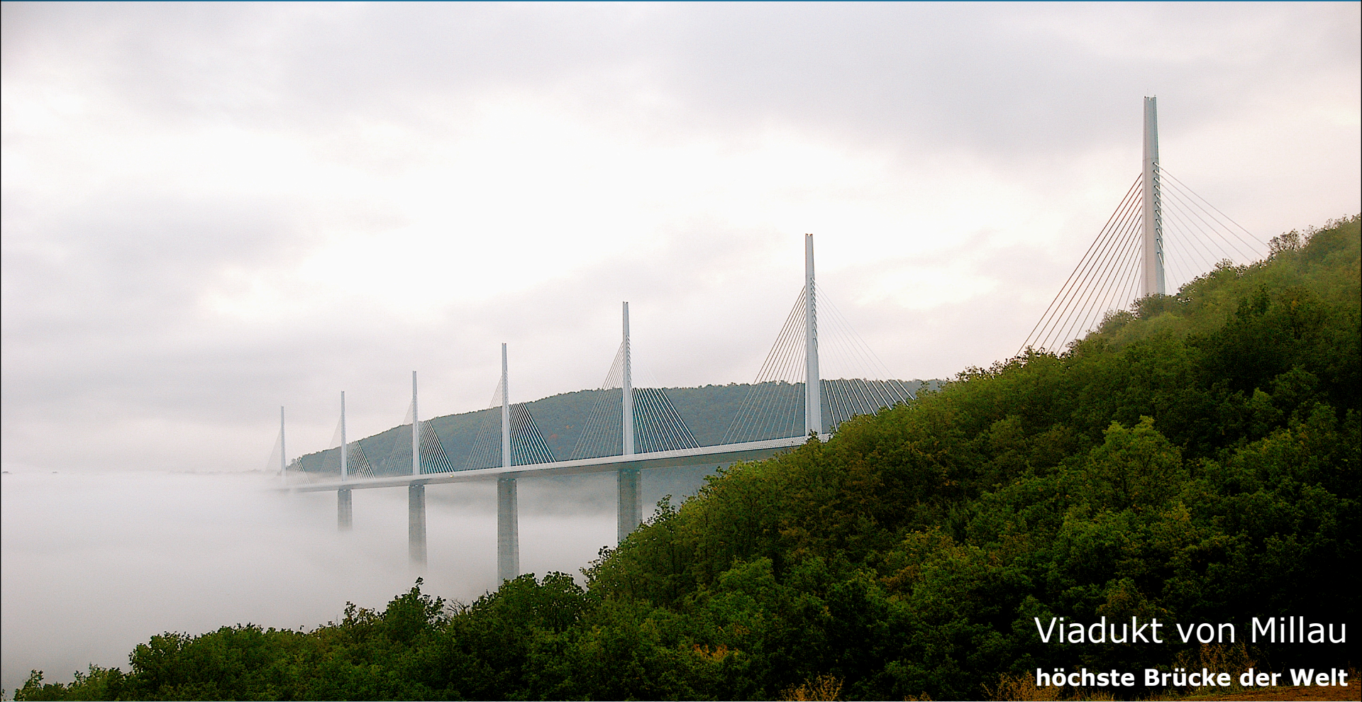
Viadukt von Millau höchste Brücke der Welt